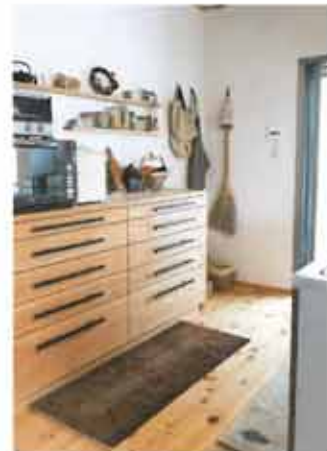
水をはじくのでキッチンマットにも◎。クルミの木と実の皮で染めた落ち着いた色柄。