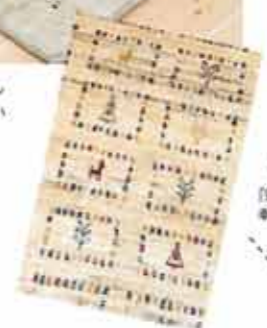
「夏」や「生命の木」など幸せなモチーフがたくさん！