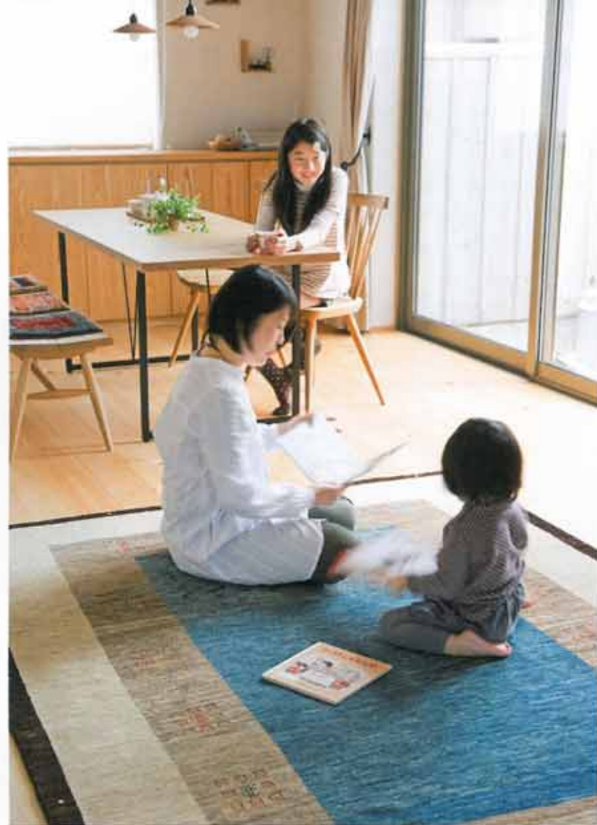
天然素材100%だから安心して使える心地よさ。「子どもたちも無意識にナデナデしています(笑)」