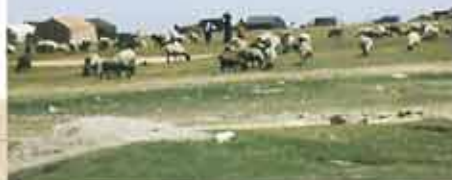
イラン南西部の高地。