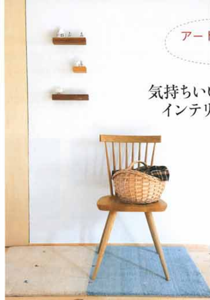
「生成りとインディゴブルーのシンプルなデザインにひとめぼれ。北欧風にコーディネートして、コーナーをつくってみました」