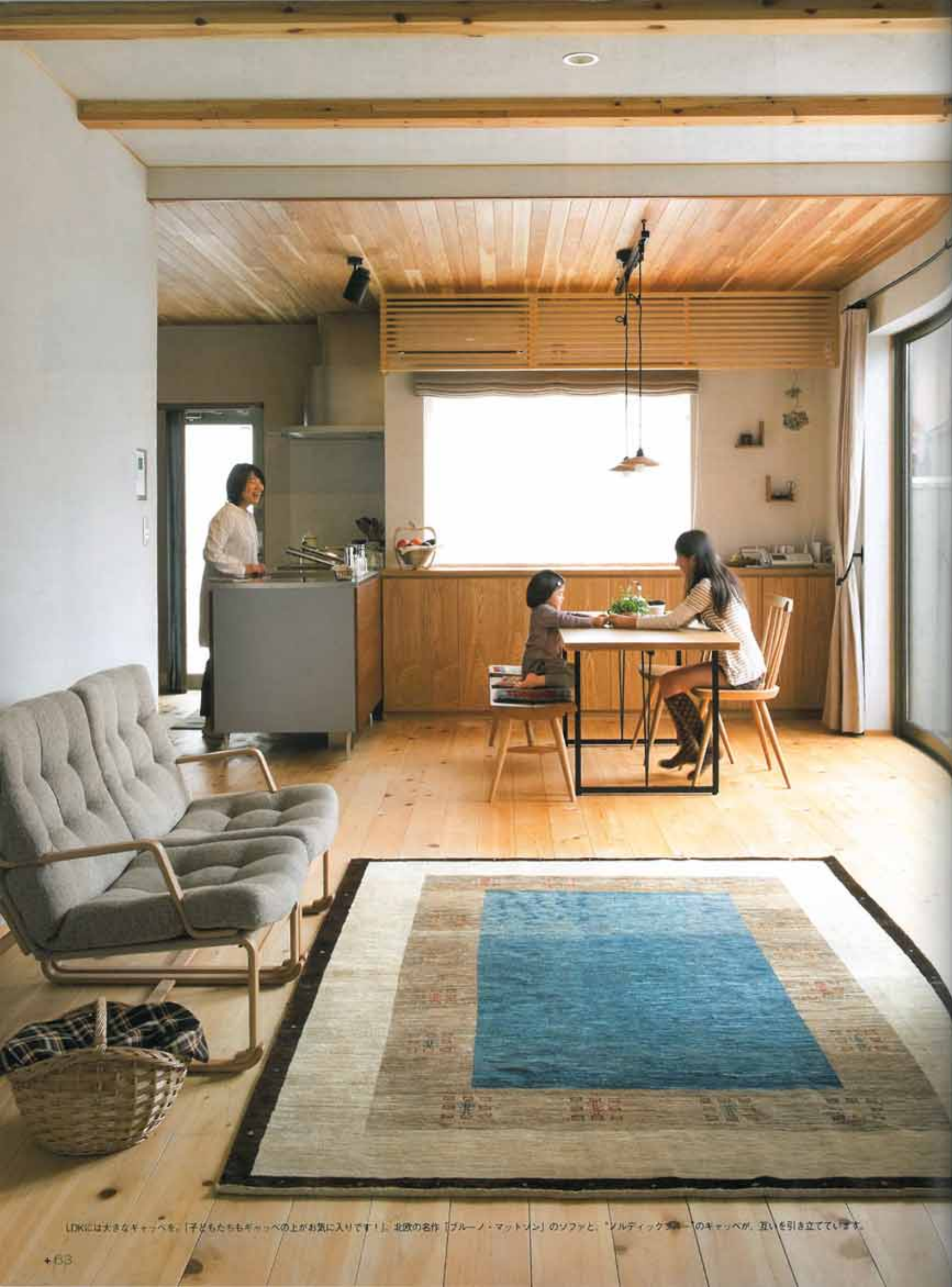
LDKには大きなギャッベを、「子どもたちもギャッベの上がお気に入りです!」。北欧の名作「ブルー・ノ・マッドソン」のソファと、「ソルディック」のギャッベが、互いを引き立てています。