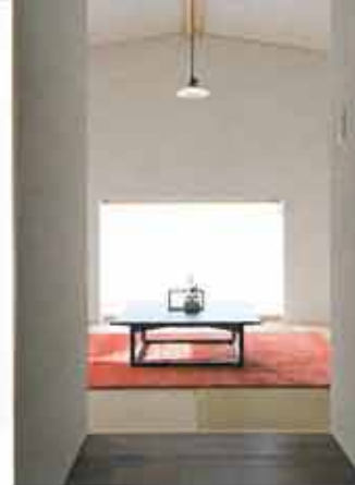
和室には、藍の根で染められたギャッベも。日本の伝統色にも通じる味わい深い色みです。