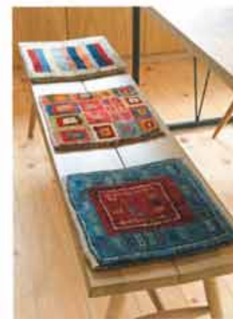
アイアンの脚がほどよくカッコいい。タモ材のダイニングテーブル。ベンチには、産布団サイズのギャッベを敷きました。インテリアのアクセントになって、おしりもふんわり。