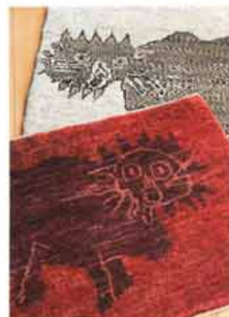
子どもが描いたライオンの絵をモチーフに特注で織ってもらった、オリジナルギャッベ。